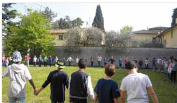
Ad Alta Voce