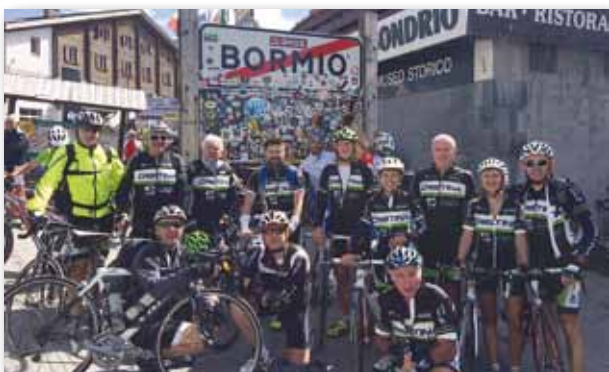
Stelvio Bike Day - 29 agosto 2015

Oltre alle uscite domenicali e infrasettimanali ricordiamo alcuni giri che hanno coinvolto le famiglie e i simpatizzanti: il giro della Toscana, svolto in primavera, che ci ha permesso di conoscere territori naturali e culturali di splendida bellezza.