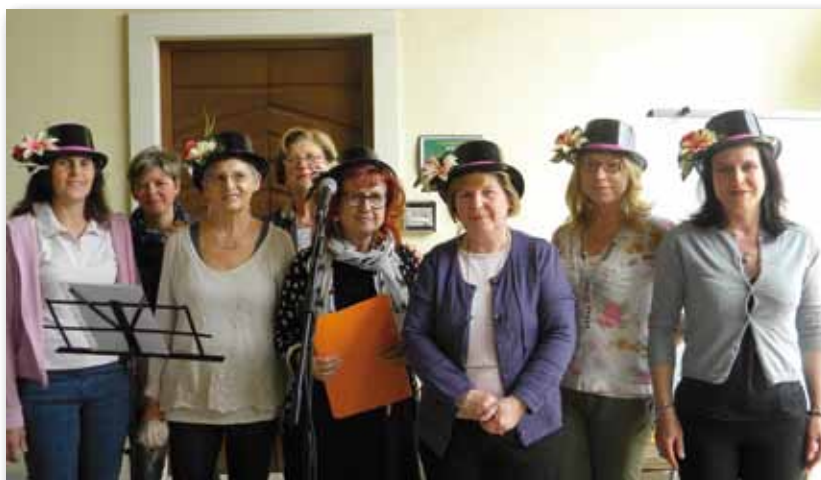
Le Mamme Lettrici

finalizzato delle nuove tecnologie in biblioteca, facilitando così il collegamento tra diversi livelli di studio e di apprendimento. Per i più piccoli, le visite guidate e le animazioni alla lettura contribuiscono allo sviluppo dell’immaginazione e della fantasia.