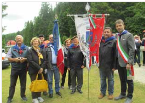
Gonfalone Comunale e Bandiera della nostra Sezione del Fante

In data 21 Giugno 2015, in occasione dell'annuale Pellegrinaggio in Val Magnaboschi di Cesuna, la nostra Sezione con alcuni dei suoi iscritti ha partecipato alla Manifestazione, giunta alla sua XXII edizione, che ha assunto un punto fisso nel calendario delle ricorrenze in campo nazionale e internazionale con la partecipazione di delegazioni estere dell'Austria, della Slovenia e dell'Ungheria i cui soldati in questi luoghi combatterono e morirono. In questa occasione vengono ricordati i caduti di tutte le nazionalità che sono sepolti nel cimitero denominato "degli abeti mozzi".