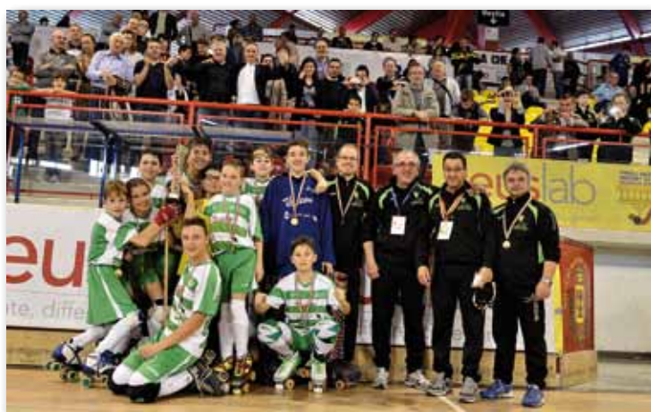
La squadra U15 vincitrice a Bassano della Coppa Italia