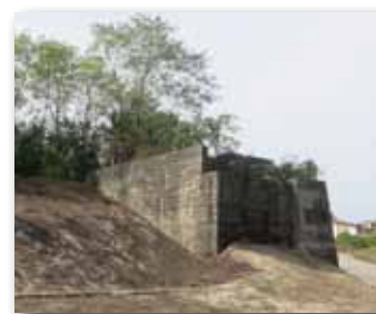
La testa del ponte ferroviario oggi

istituiscono subito una commissione per studiare le possibilità di completare l'opera in corso, si contattarono le Tranvie Vicentine e la Società