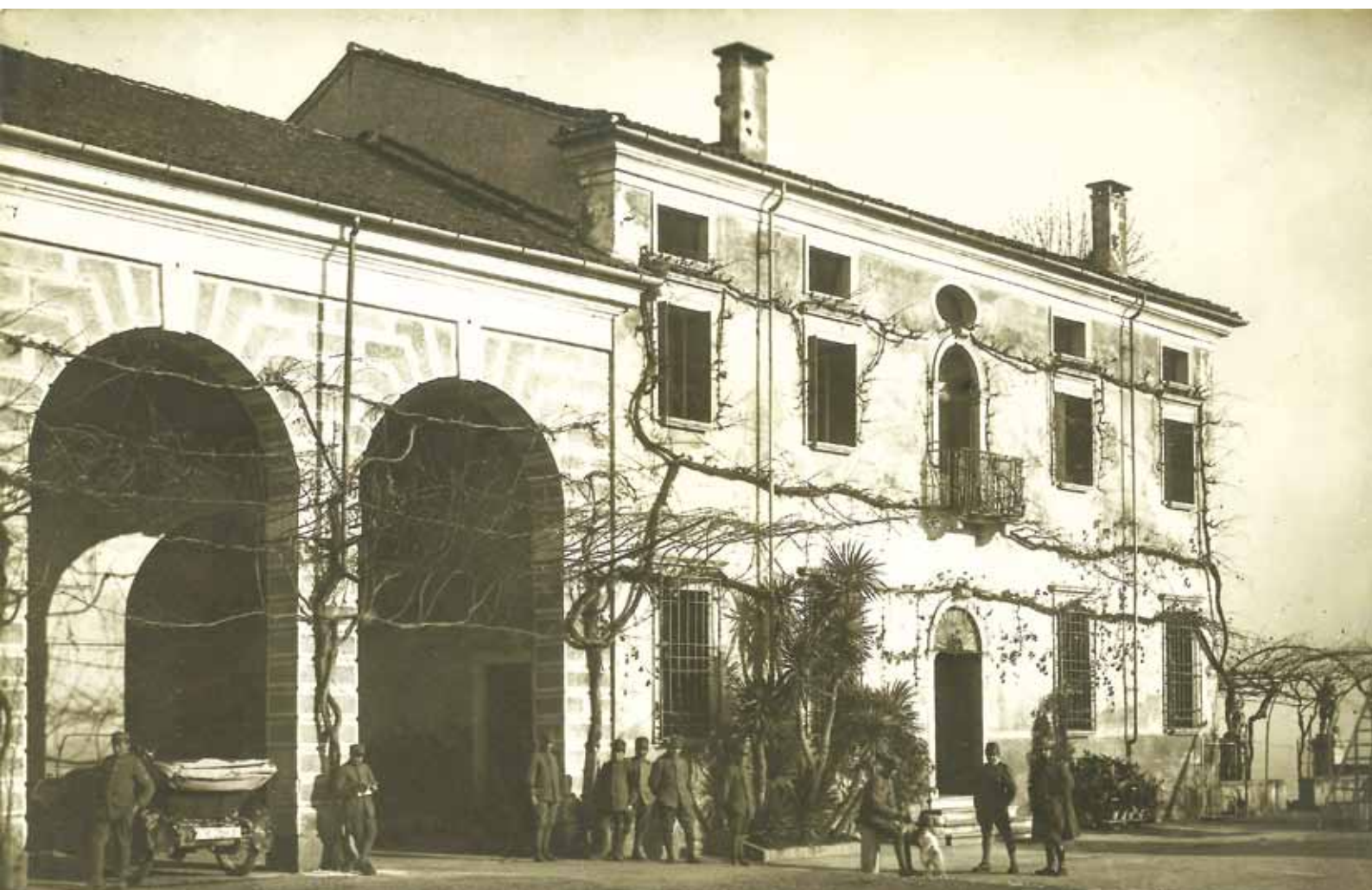
Villa Cita 1917 - Comando settoriale dell'Aviazione Militare Italiana

Periodico edito dall'Amministrazione Comunale di Montecchio Precalcino