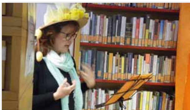
Lettrici in “azione”