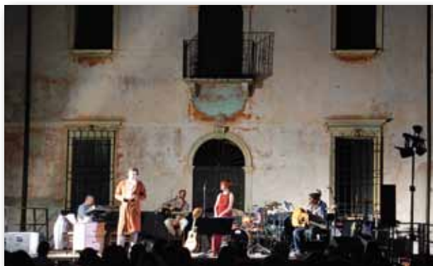
Lunaspina Musica e Teatro

La giovane compagnia “L’Archibugio” di Lonigo ha