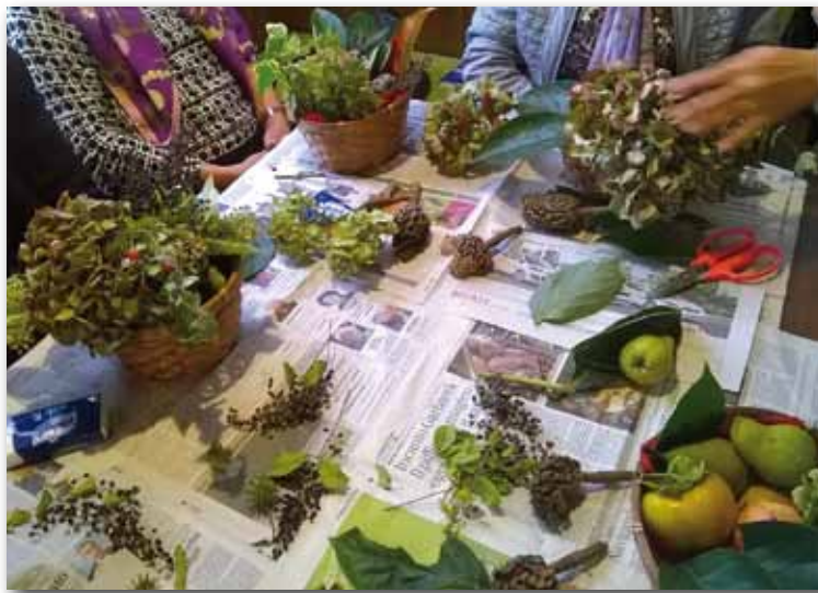
Un laboratorio creativo al Centro di Sollievo

Tutto questo per stimolare le abilità presenti, per creare un clima sereno, gioviale e per colorare di vita il martedì mattina.