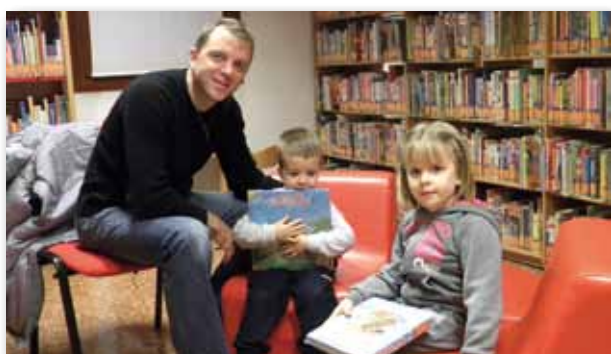
In biblioteca con papà