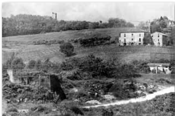
Anni '70: testa del ponte ferroviario a Montecchio Precalcino

I lavori iniziarono subito sotto la guida del genio militare e con l'aiuto di numerose maestranze civili l'opera proseguì velocemente. Si sbanca l'unghia del monte, a lato casa Berlatto, per ricavare un passaggio in trincea si realizzano ponticelli sopra varie rogge e