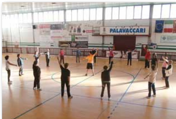
Il gruppo di ginnastica per adulti e anziani

Nella stagione in corso, l'A.s.d. Muovi la Salute ha avviato, all'interno del territorio comunale, diversi corsi di attività motoria. Uno rivolto ad adulti ed anziani che si svolge ogni mercoledì e venerdì alle 9.30 presso il Palavaccari e dei corsi rivolti a giovani e adulti, che si svolgono dal lunedì al giovedì alle 20.30 e il venerdì alle 19.30 nella palestra delle scuole elementari "Mario Rigoni Stern".