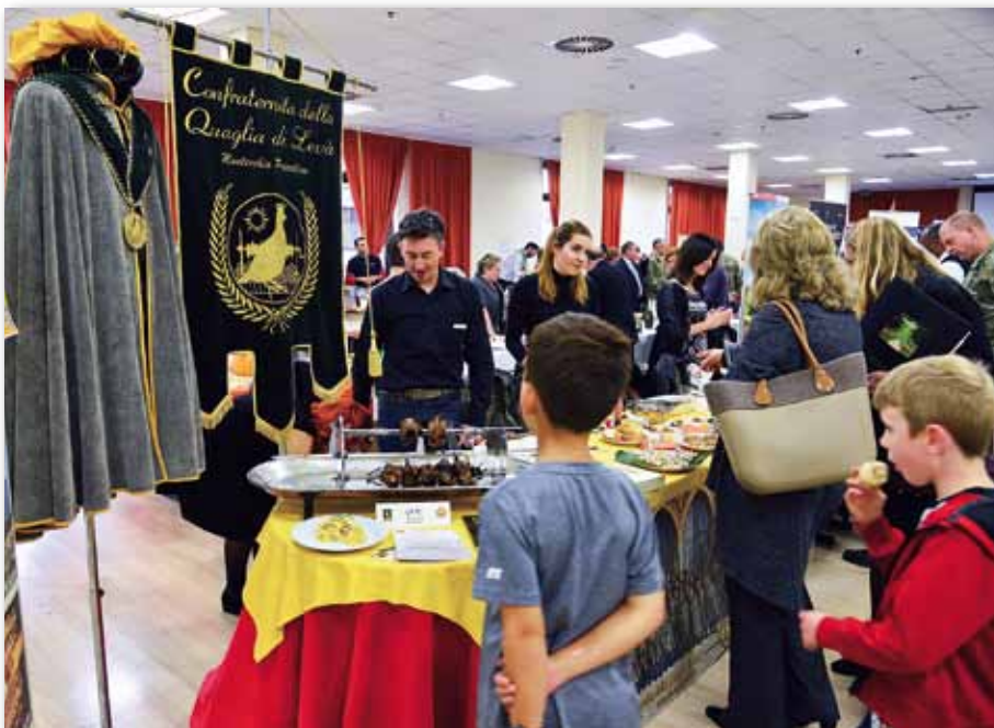
"Meet the Mayors" all'interno della caserma Ederle di Vicenza al quale sono stati invitati i vari comuni di Vicenza per promuovere il loro territorio