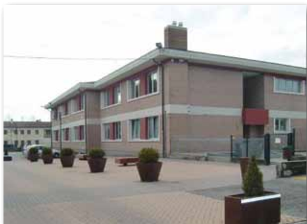
Esterno della scuola media prima e dopo l'intervento