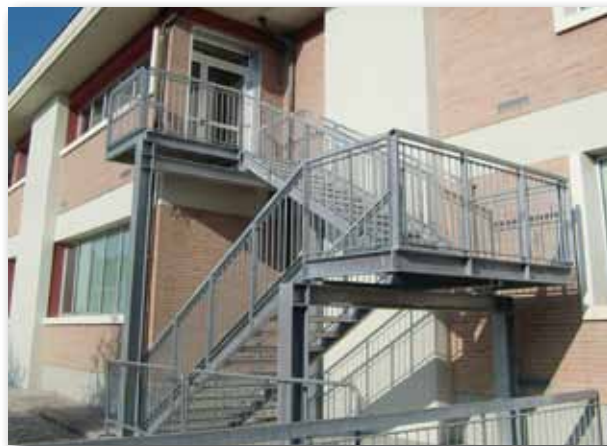
Nuove scale di sicurezza antincendio