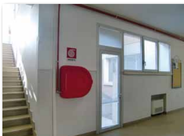
Nuovo impianto antincendio

Per l'efficientamento energetico è stata prevista la sostituzione dei mobiletti riscaldanti.