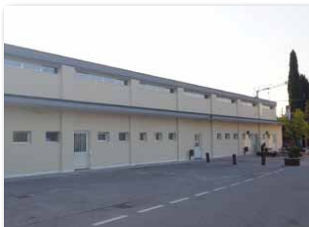
Nuovi serramenti e cappotto termico

È stato inoltre effettuato un intervento di efficientamento energetico dell'edificio su due distinti fronti: