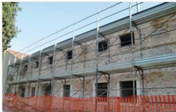
Lavori in corso al Palazzon