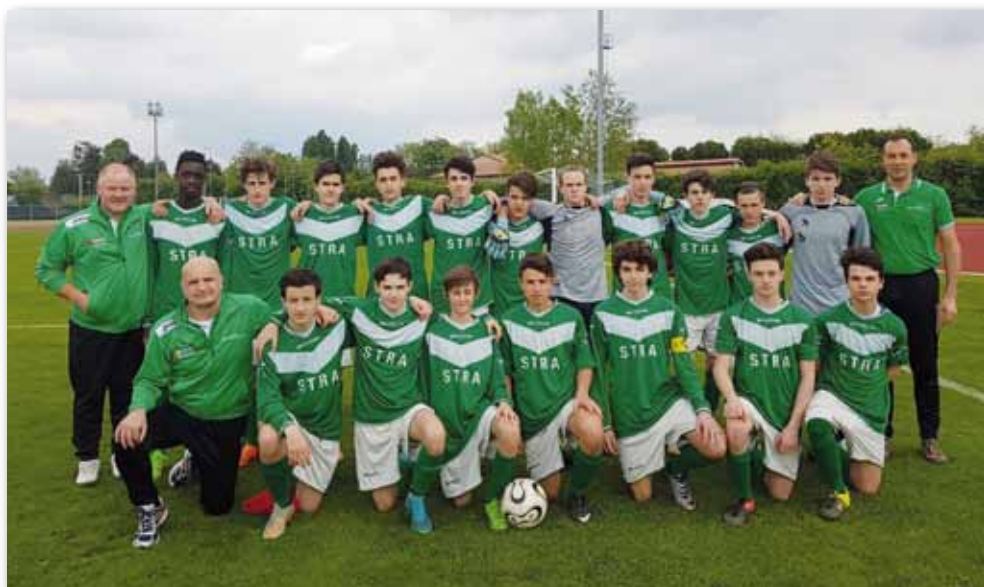
La formazione dei “Giovanissimi”, primi classificati nella scorsa stagione

Un piccolo paese con tante realtà, persone attive che hanno fatto una piccola - grande società che ha saputo imporsi con onore e dignità nel panorama del calcio dilettantistico vicentino.