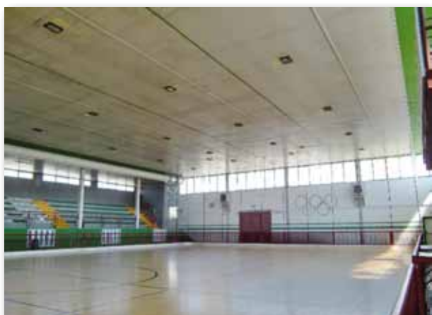
Illuminazione palazzetto prima e dopo