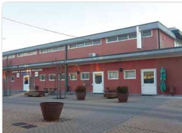
L'esterno del palazzetto com'era prima dell'intervento