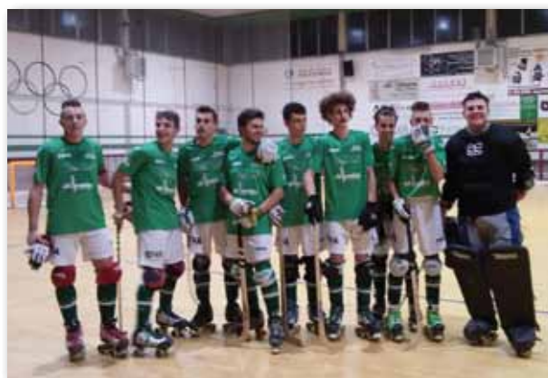
La serie B arrivata 7 a in Campionato