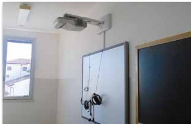
Interno di un'aula dopo i lavori di tinteggiatura

La spesa complessiva di 342.799,20 euro è stata finanziata in parte con oneri del Comune ed in parte con un contributo statale gestito dalla Regione Veneto di 136.251,03 euro.