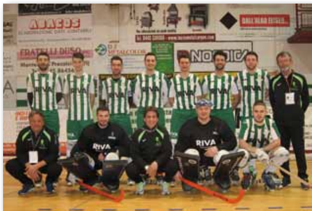
La serie A2 arrivata 5 a in Campionato

La stagione 2015-16 è stata positiva per l'Hockey Club Montecchio Precalcino. La società si è presentata al via della stagione ufficiale con squadre iscritte in tutte le categorie oltre alla novità serie B. Queste le categorie onorate: la serie A2 nazionale, la serie B, l'under 20, l'under 17, l'under 15, l'under 13, l'under 11 e il minihockey con l'avviamento all'hockey. Le categorie under 17 e 15 sono state possibili grazie anche alla collaborazione con la società Sandrigo Hockey. Il risultato agonistico da mettere in evidenza è stata la storica qualificazione ai play off promozione della squadra di serie A2 , raggiunta arrivando al quinto posto di un campionato difficoltoso e di alto livello. L'hockey Montecchio ha saputo recitare un ruolo di prim'ordine contro avversari più blasonati grazie soprattutto al gioco totale applicato da mister Carlos Carpinelli e allo spirito di un gruppo unito fino all'ultimo.