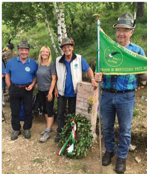
Il nostro Capogruppo con i gemellati di Vallarsa.

A malga Cheserle si è svolto l'alzabandiera e sono stati resi gli onori ai Caduti presso il cimitero austriaco, alla presenza dei vessilli delle Sezioni Alpine di Trento e Vicenza con i gagliardetti dei gruppi alpini di Vallarsa e dell'Alto Vicentino. I partecipanti sono poi saliti a piedi alla selletta del Monte Corno dove è stata celebrata la