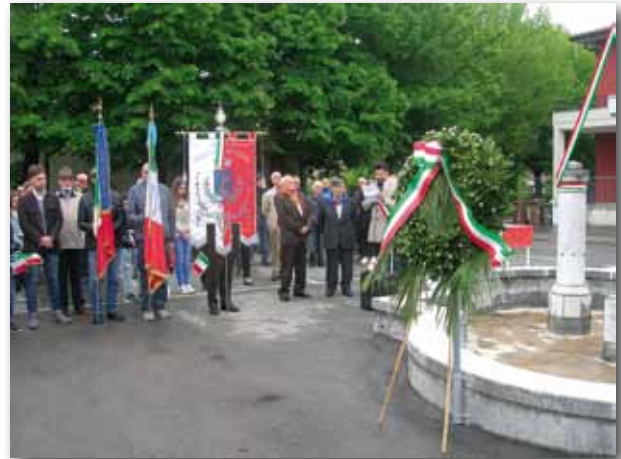
Un momento della cerimonia del 25 Aprile