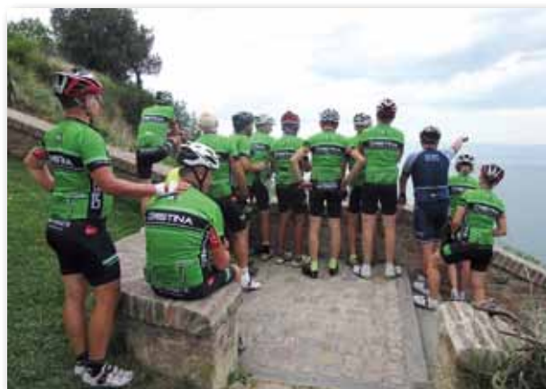
Uno sguardo verso il futuro