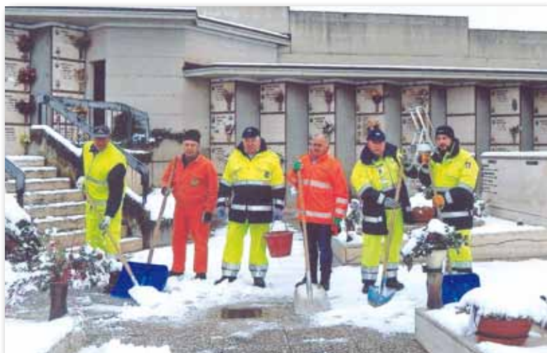
La squadra di Protezione Civile in azione dopo la nevicata

Le ditte Extraflame s.p.a. – Tecno Metal Carpen s.r.l. – D.Z. Metalcolor s.r.l. viste le "modeste" attrezzature in dotazione per questi interventi, hanno fatto