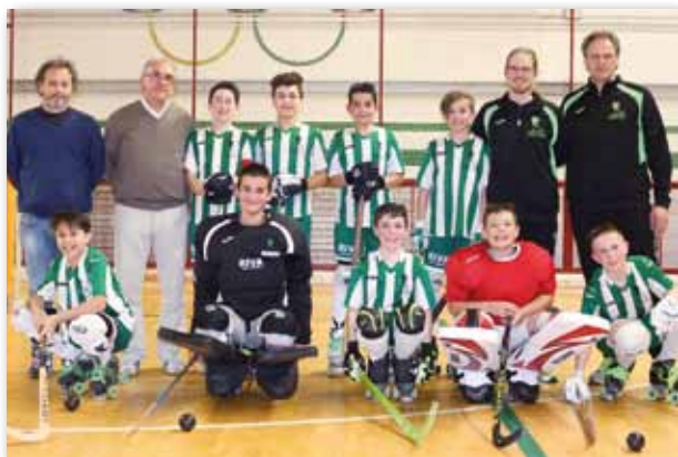
Squadra Under 13 vincitrice della Coppa Italia

alla pari con le migliori compagini provinciali mentre l'avviamento ha continuato a registrare un buon successo sul territorio, non solo comunale.