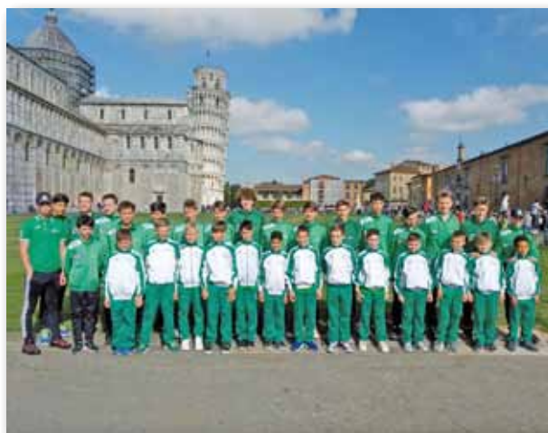
Le squadre, Giovanissimi e Pulcini al Torneo Internazionale "14° PISA WORLD CUP"