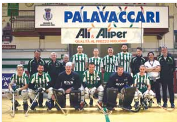
Prima squadra terza qualificata in A2 e finalista Coppa Italia

alla pari con le migliori compagini provinciali mentre l'avviamento ha continuato a registrare un buon successo sul territorio, non solo comunale.