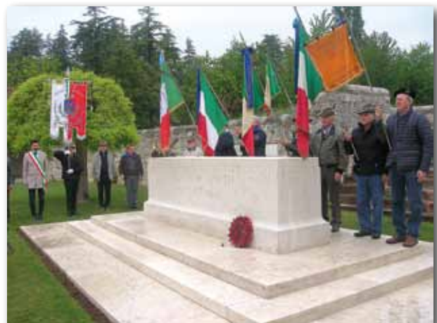
Onore ai Caduti Britannici