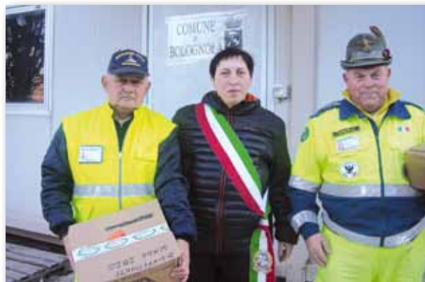
Consegna al Sindaco di Bolognola del materiale sanitario affidato alla Squadra di P. C. dal Gruppo Missionario

Nel mese di ottobre 2016 alcuni volontari sono