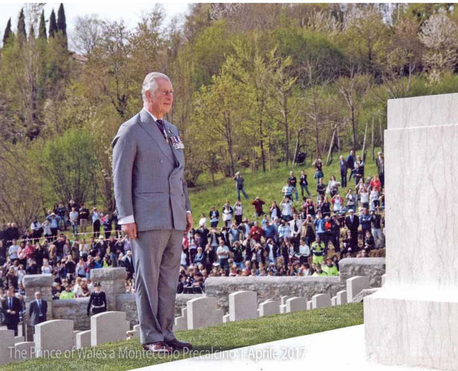
The Prince of Wales a Montecchio Precalcino 1 Aprile 2017

Periodico edito dall'Amministrazione Comunale di Montecchio Precalcino