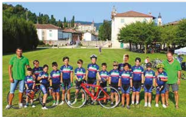
I ragazzi della "Fausto Coppi"

Il terzo avvenimento riguarda la "Giornata Rosa" tenutasi il 23 settembre. Una giornata tutta al femminile che ha visto gareggiare quasi 400 atlete divise in tre