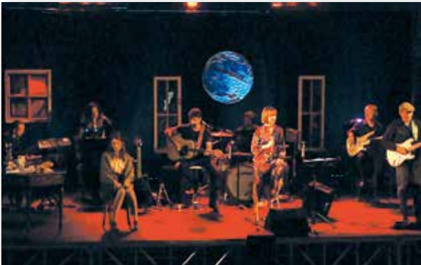
Un momento del concerto "Pane e castagne" dei Lunaspina