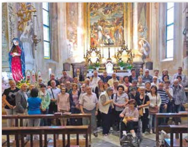
Tutti insieme all'interno del Santuario della “Madonna dei Miracoli”