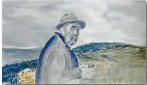
Disegnolacquerello opera di un alunno di III Media

Abbiamo scelto di portare letture da "Amore di confine", come il racconto del cane Marte, o dal libro "Stagioni", con la visione dello scrittore riferita alle sue estati. Per i ragazzi di terza media invece il tema della guerra è stato centrale con letture tratte da "Il sergente