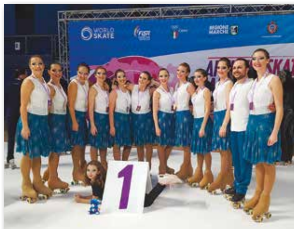
Il gruppo Project vincitore dell'Artistic Skating World Cup

Il direttivo augura a tutti i suoi atleti altrettanto successo per i prossimi impegni della nuova stagione, augura un Sereno Natale e Felice Anno Nuovo a tutti i compaesani invitandoVi a trascorrere una piacevole serata in occasione del consueto Saggio di Natale che si terrà il 16 dicembre alle ore 20.30 presso il Palavaccari.