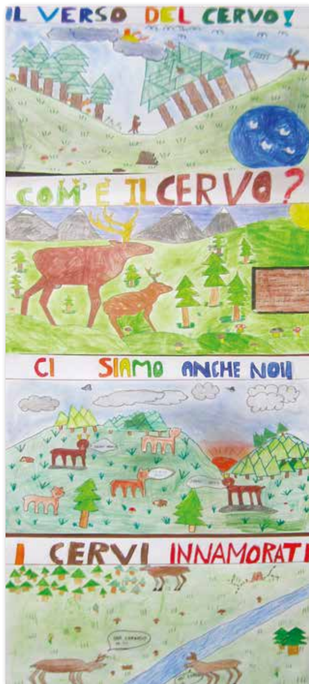
I disegni sono delle classi 5 a A, 5 a B e 3 a A della scuola Primaria

la nostra gente, quello della seconda guerra mondiale con la ritirata dalla Russia che lo ha visto protagonista in prima persona.