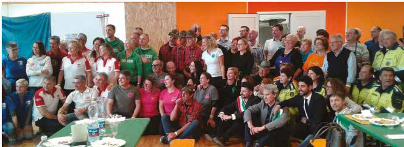
L'Amministrazione Comunale ringrazia tutte le associazioni del paese che hanno collaborato alla realizzazione del pranzo solidale