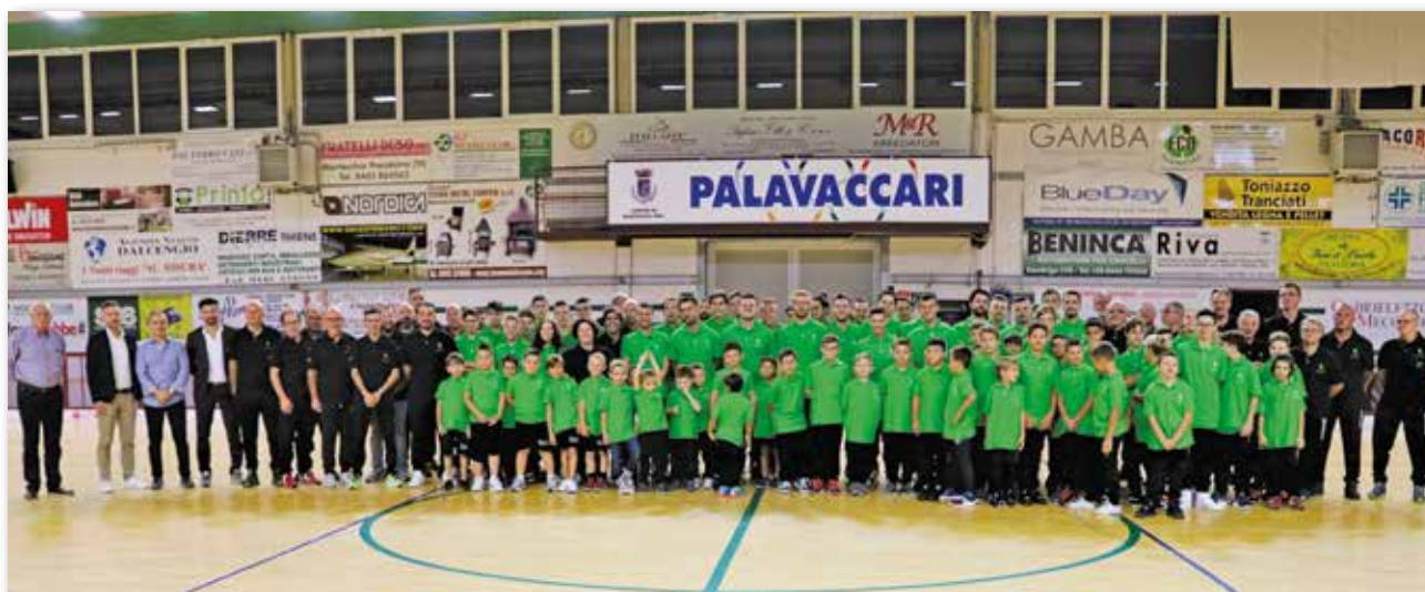
Presentazione delle squadre per la stagione 2018-19