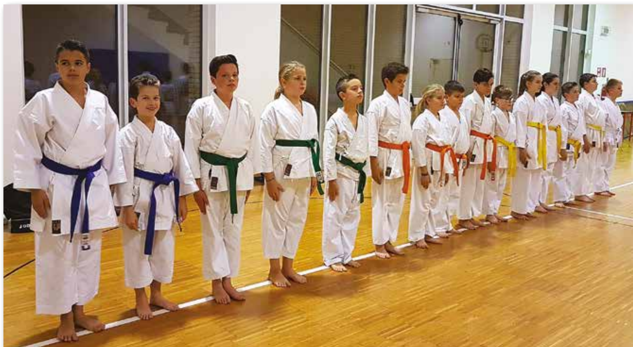
I ragazzi delle cinture colorate fino ai 16 anni

Tutti i martedì e venerdì presso la palestra della scuola primaria di Montecchio Precalcino in Via Maganza, sono attivi i corsi di karate per bambini e ragazzi.