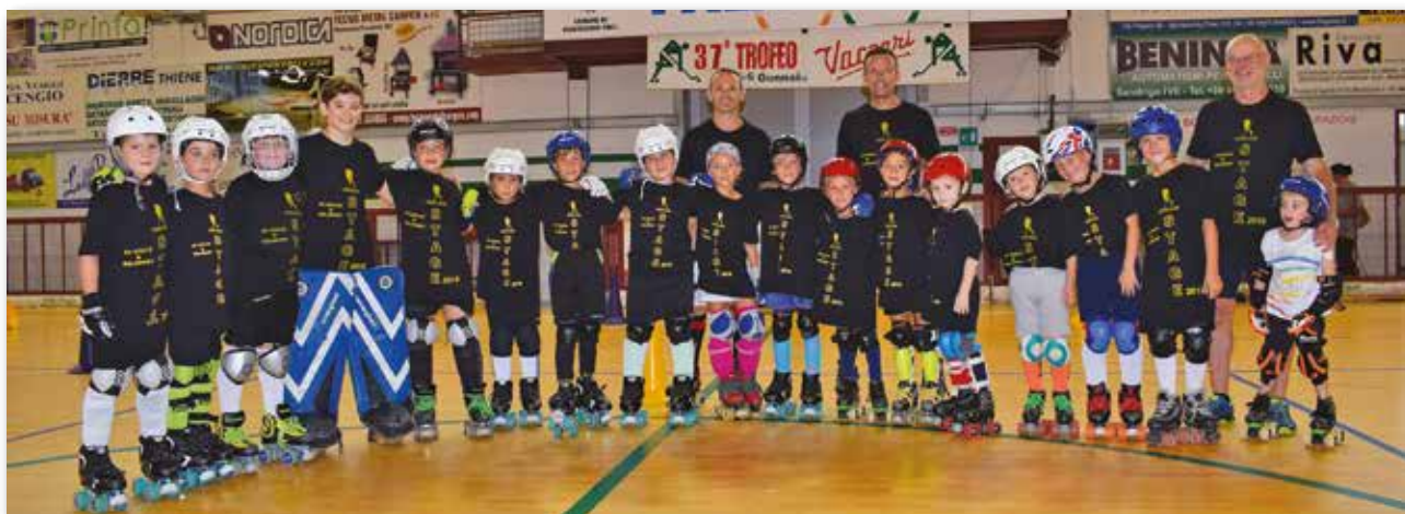
Gli atleti più giovani che hanno partecipato allo STAGE 2018