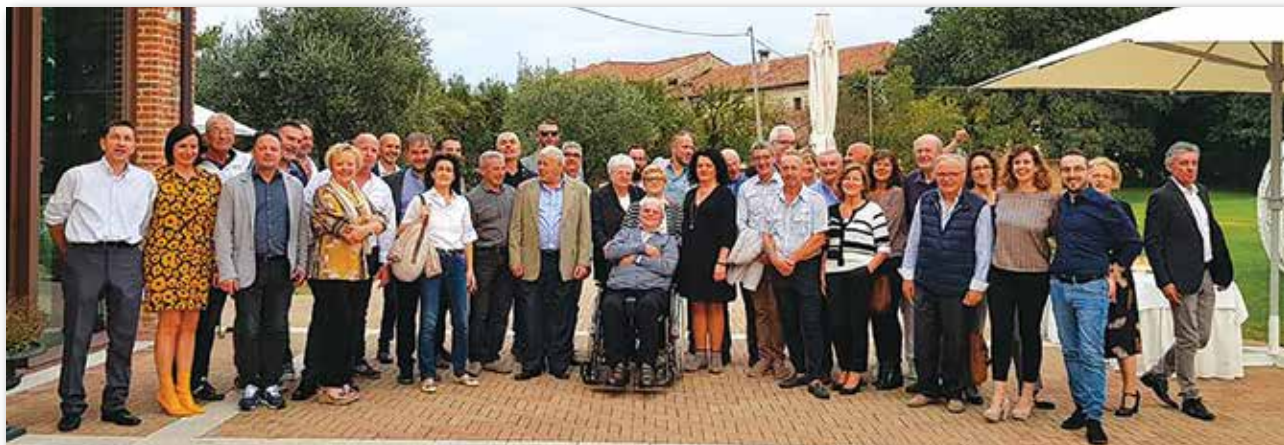
Alcuni soci donatori di Montecchio Precalcino

Nel 2019 festeggeremo i cinquant’anni di FIDAS a Montecchio Precalcino. Stiamo preparando gli eventi.”