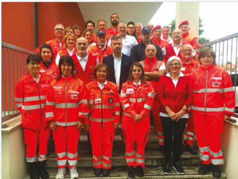
I partecipanti al 1° corso base di Protezione Civile e Primo Soccorso

Con Decreto n. 7226 del Sovrano Consiglio del SMOM del 1° ottobre 2011, il Corpo Italiano di Soccorso dell'Ordine di Malta viene trasformato in una Fondazione ovvero un "ente di diritto melitense" con personalità giuridica pubblica, riconosciuto dalla Repubblica Italiana come previsto dall'art. 8 dell'accordo