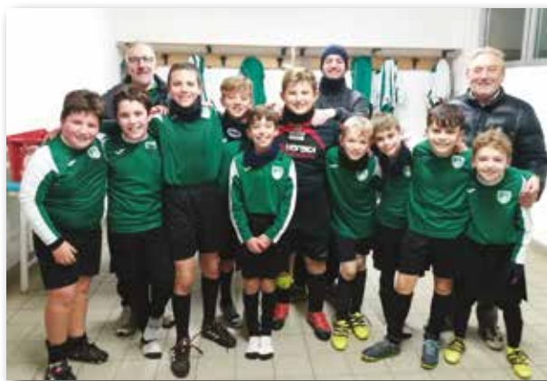
I Pulcini vincitori del girone autunnale 2018

La fase autunnale della Stagione Sportiva 2018-2019 è stata coronata dal successo della squadra dei