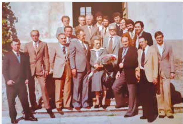
Il Consiglio Comunale davanti a Villa Cita nel 1978