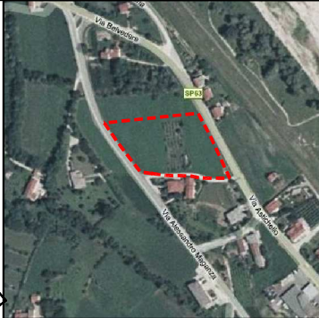
Inquadramento territoriale Fig. 3 mapp.le n°202