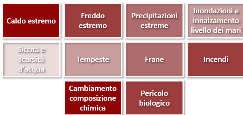
Figura 2 Pericoli climatici oggetto dell'analisi di impatto dei cambiamenti climatici