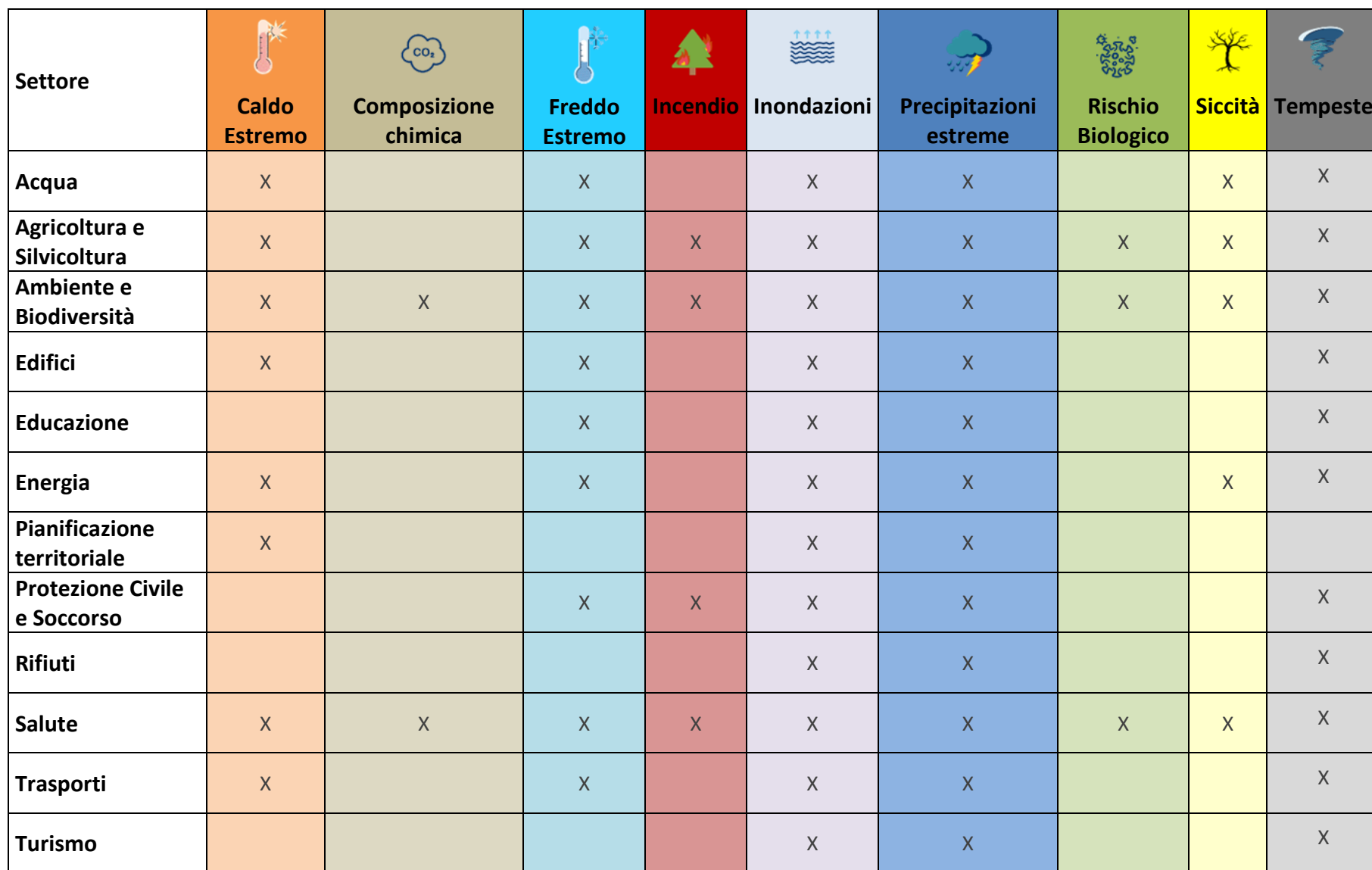
Tabella 3 Matrice Pericoli climatici – Settori impattati